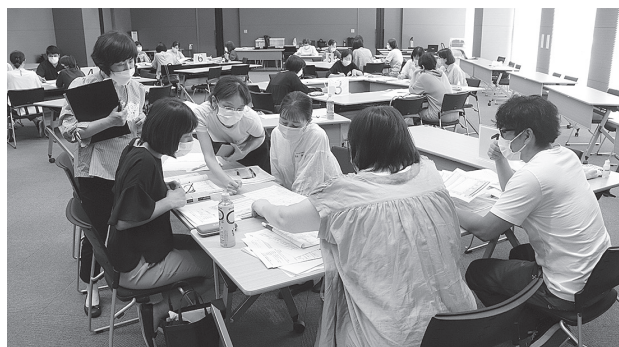
②スキルアップ研修会