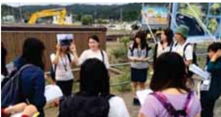
実際に被災された岩手県立大学の学生から、宮古市の被災前後の様子、現在の宮古市周辺の様子を聞いているところ。

実際、東北には約2週間の日程で、被災地を訪れたり、仮設住宅の訪問やレクリエーションの計画、学習支援、漁業や農業活性化のお手伝いといった活動をしてきましたが、自分の目で見て、他大学・他学部の学生と意見交換をする中で、自分の中でも考え方が変化するのがわかりました。はじめは震災から3年間経過した今、自分のできることがあるのかという疑問もありました。