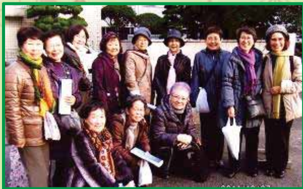
11回生の集い(永国寺キャンパスの正面玄関にて)

南学長: 今の自分の財産だと思っているのは、同窓会なんです。私の個人的に11回生は22人で、今は18人の住所も全部かかっていて、連絡が取れる。この間、卒業して50年たったんで高知で同窓会って、ここでみんな話し合ったりしたんですけど、12人来れたんですよ。現役のフルタイムで働いている人が私を入れて3人。同窓会を毎年、ずっとやっていたんですよ。3年ぐらい前までは。