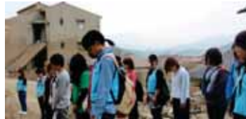
甚大な被害を受けた八木地区での献花と黙とう