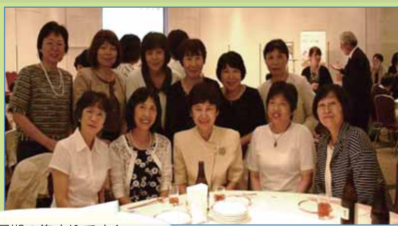
同期の集まりです！