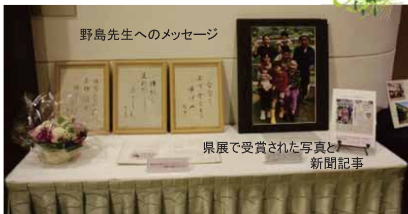
県展で受賞された写真と新聞記事