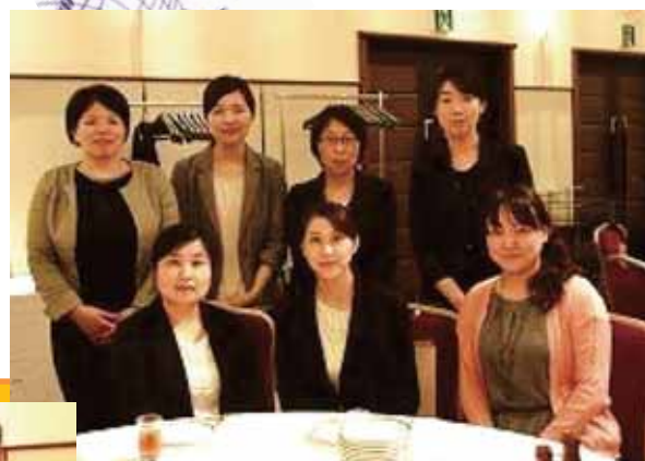
県内外の同窓生が 集いました