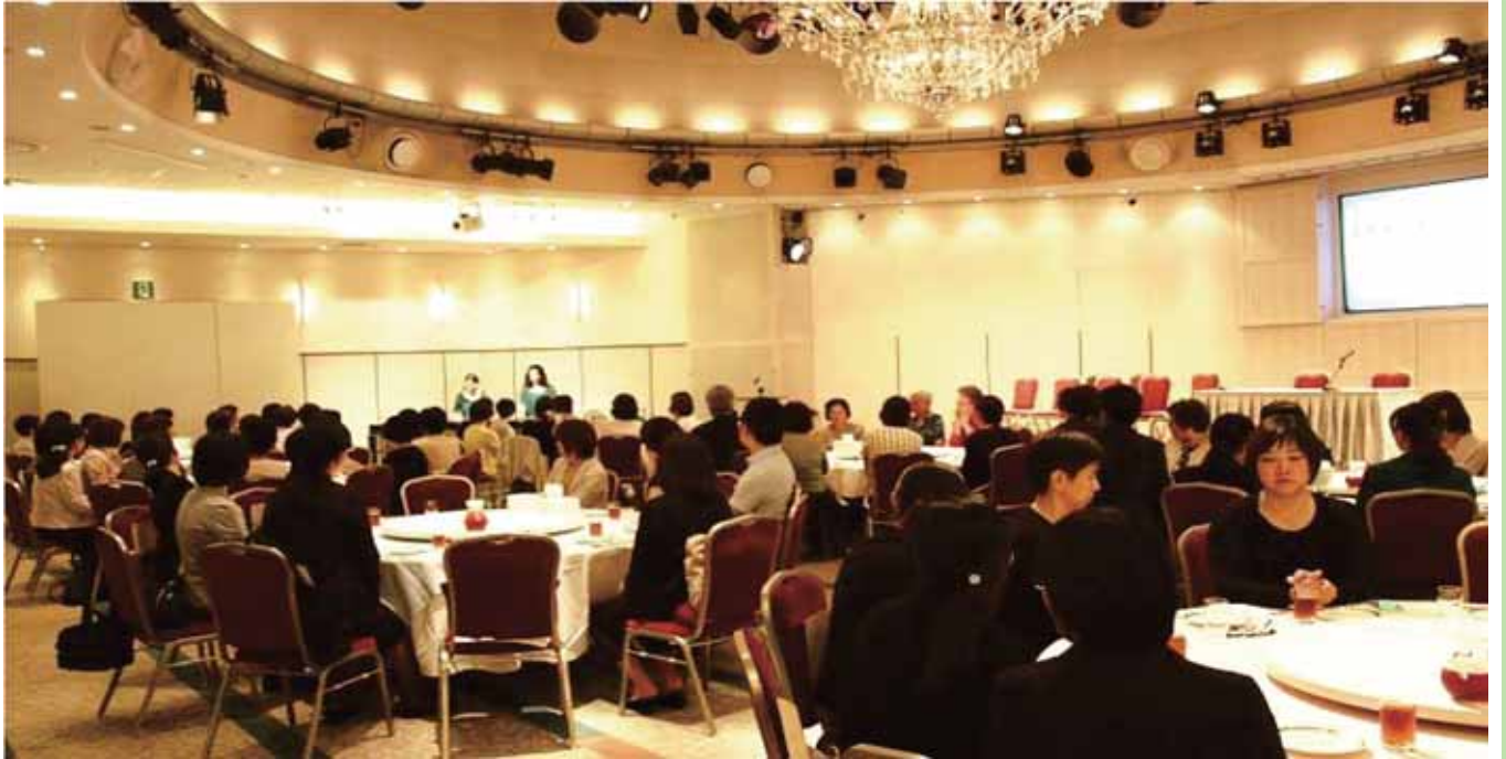
懇親会(ラ・ヴィータにて)