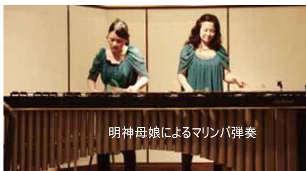
明神母娘によるマリンバ演奏