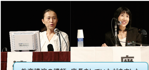
教育講演の講師、座長をしていただきました

学術集会では、本学在学学生・修了生が、講師、座長、学会ボランティアとして運営に携わり活躍しました また、演題発表者として学会を盛り立ててくださいました