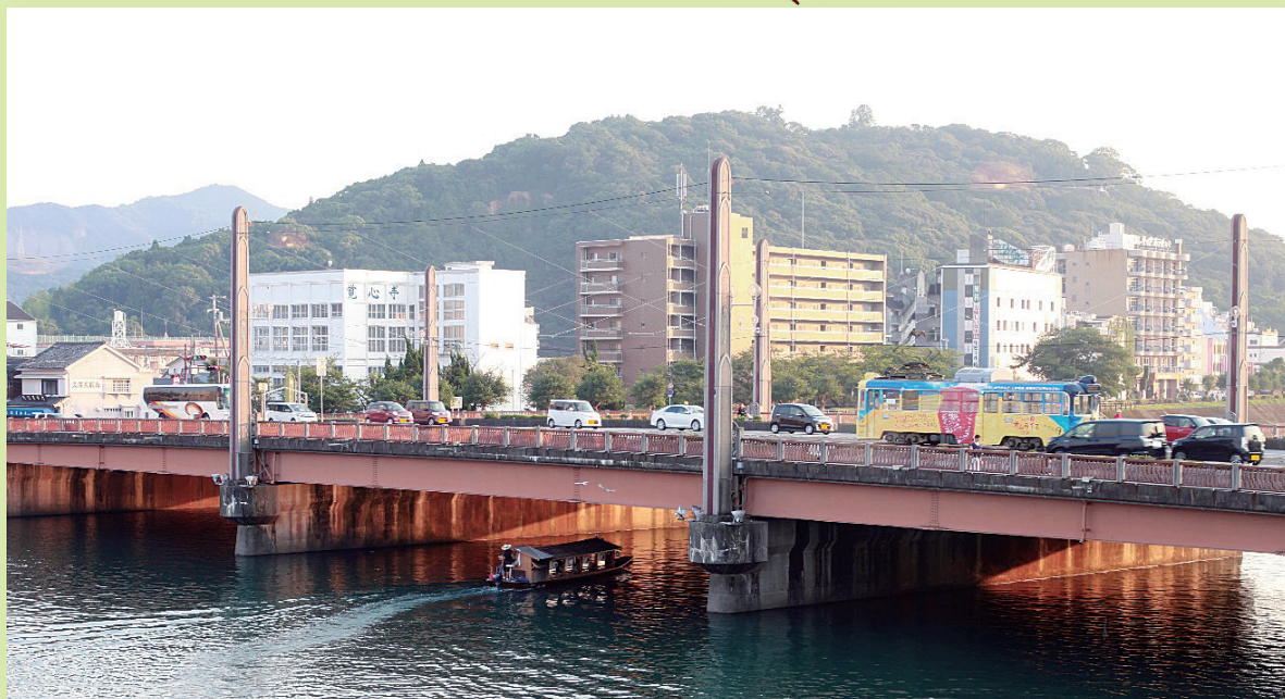
同窓会総会にて(料亭濱長からみた鏡川と筆山)