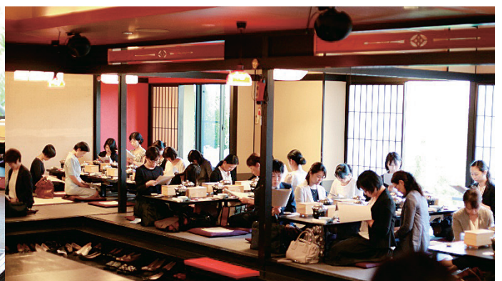
総会における同窓会役員