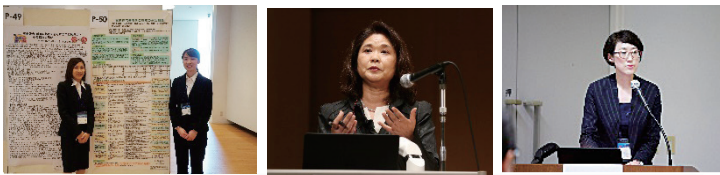
たくさんの卒業生、修了生が演題発表しました 座長をしていただいた方もたくさんいます