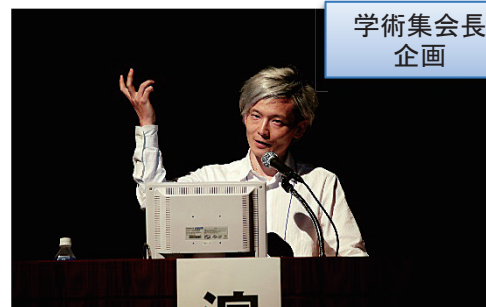
慶應義塾大学医学部医療政策・管理学教室 宮田裕章先生