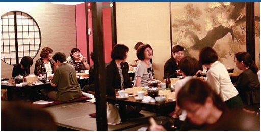
土佐のお座敷遊びといえば ・・・しばてん踊り!!