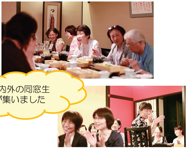
県内外の同窓生 が集いました