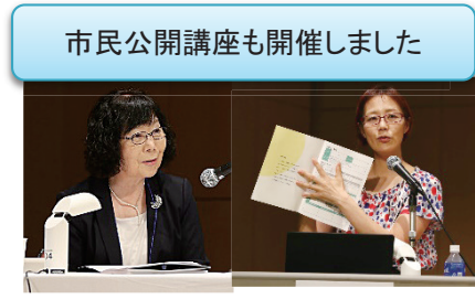
市民公開講座も開催しました