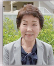
梶原和歌同窓会 会長(10期生)

上記学術集會に看護学部同窓会会長として招待していただきましたので思いつく感想を述べさせていただきます。