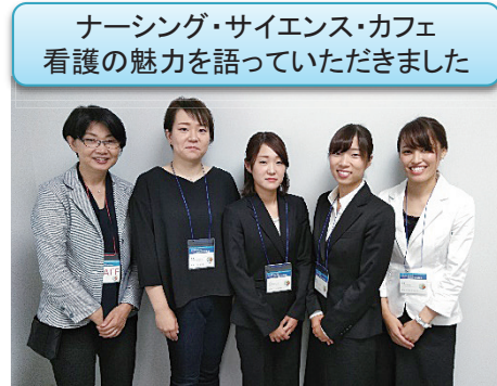
ナーシング・サイエンス・カフェ 看護の魅力を語っていただきました