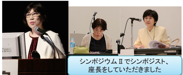
シンポジウムⅡでシンポジスト、座長をしていただきました