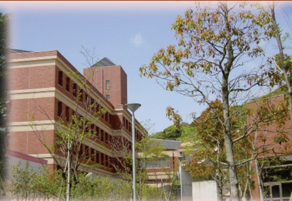
池キャンパス校舎