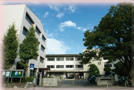
旧永国寺キャンパス正門

原 私も、この大学で学ばせていただいている意味や、高知県で発展していく、貢献していくことができるのか、同窓会という切り口や、こういうテーマを通して、あらためて考える機会にもなりました。先輩方の支えあつてのこれまでだったので、これから自分がどういうふうに関与していけるのかということを考えていきたいと思っています。