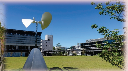
永国寺キャンパスモニュメント