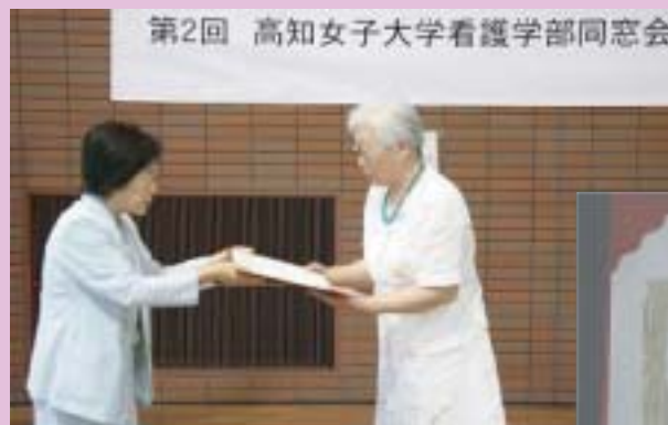
松本女里副会長から授与