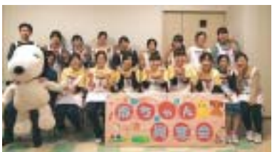
高知医療センターでの「赤ちゃん同窓会」の様子

「地域の健康生活を創造する」という教育理念のもと、看護学部の学生さんは地域の様々な場で、ボランティア活動をしています。高知医療センターでのボランティアや地元の小学校での読み聞かせや保健指導など、地域の人々とのつながりの大切さを毎日の生活の中で培っています。