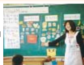
わかりやすい授業になるように工夫しています