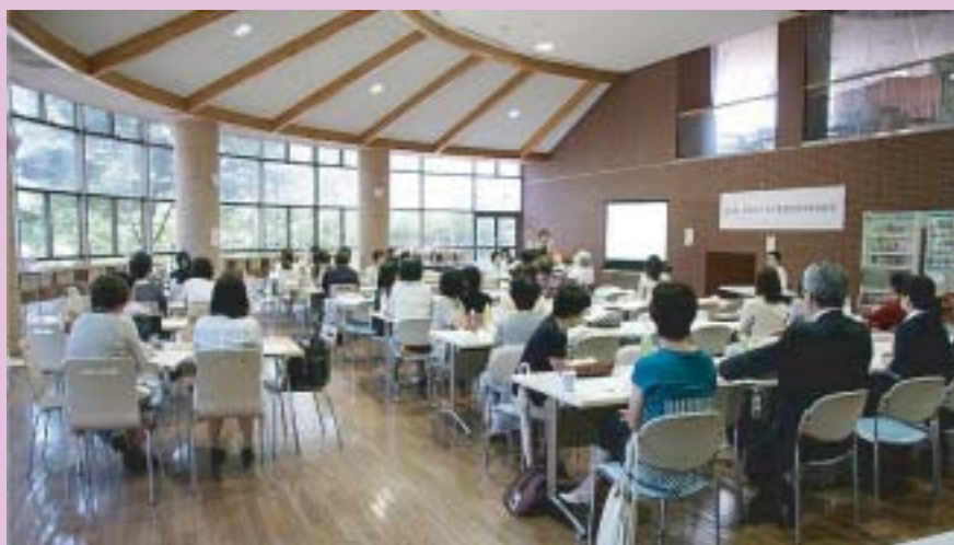
カフェテリアでの総会の様子