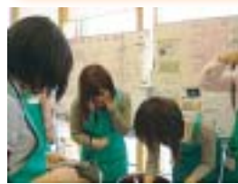
高知医療センターボランティア「ハーモニーこうち」の一員としてがんばっています