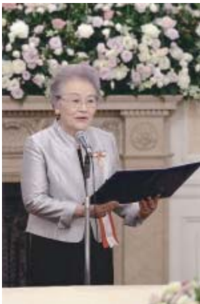
受章者を代表してお礼のあいさつ

受章者は、女史の誕生日である5月12日に赤十字国際委員会から発表され、記章は国の元首もしくは、各国赤十字社の総裁、これに準ずる者から授与されます。