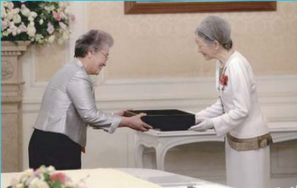
フローレンス・ナイチンゲール記章授与式にて