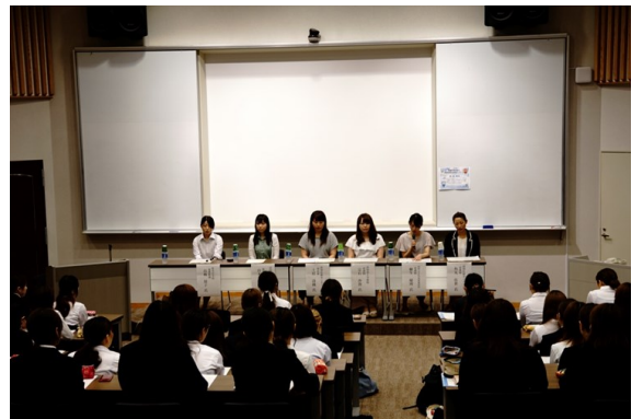
看護師・保健師・助産師・養護教諭として活躍する先輩方

6月18日（土）、3回生では「保健医療系就職ガイダンス」が開催されました。これは、将来の進路を具体的に考えることを目的とした会です。まず、高知医療センター看護局長より、臨床の場で求められる看護師について、教員からは、就職後のキャリアアップについて、お話しいただきました。また現在、看護師・保健師・助産師・養護教諭として活躍している先輩には、今の職種を選択した決め手等について、学生からの質問に具体的にお答えいただきました。学生は、この会を主体的に運営し、熱心に話を聞いていました。自分の将来像を描く手がかりをつかめたようです。