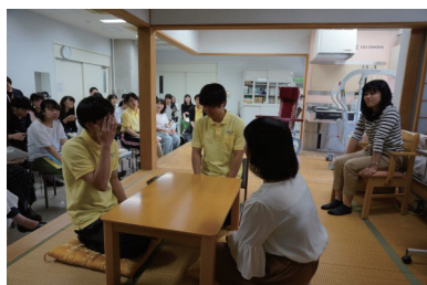
看護学部での授業の様子

高校までとは違い、大学では自ら進んで学び、追求していく姿勢が必要となります。入学時から自らの将来像を描き、学びたい科目を選択していくことが、学習意欲や主体的な姿勢へとつながっていくと考えます。これからも、学生の皆さんが自らの夢を実現する力や社会で活躍する力を着実に養うことができるよう支援していきたいと思ひます。