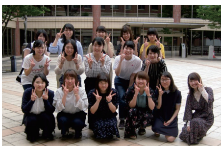
●いけいけサロン活動

「いけいけサロン活動」は、平成27年度から活動を続けている団体です。池キャンパスがある池地区で、住民の方と学生で地域交流の促進を目指して活動しています。自分たちの足で地域を回ったり、人が集う機会を作ったり、地域の方々に向けた機関紙「池の暮らし」を発刊する等、地域住民の皆さんと一緒に活動しています。地域の方から「せっかく看護の学生さんと一緒に活動しているから、健康のことをもっと伝えてほしい」という声をいただき、平成30年度は、これまで学んできた看護の知識を使って健康情報を伝える活動を積極的に行っています。地域の皆さんにも、学生の学びを育てていただいています。