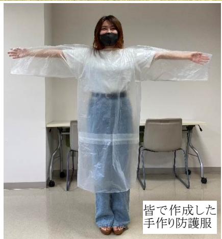
皆で作成した 手作り防護服

[ニュースレターの名前の意味]fure-fure 学生さんを応援する気持ちを込めて、学生さんが、誰かを応援できるようになる願いを込めて、この名前を付けました。