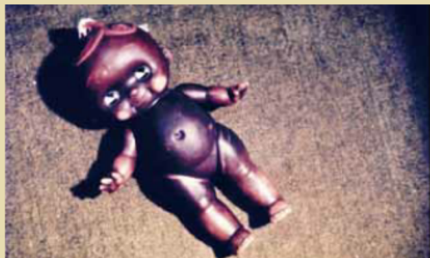
▲廃液の影響で黒く変色したキューピー人形 （『よみがえれ!浦戸湾』より）

ゼミ生F 高知パルプの近くに住んで、持ってる物がどんどん黒くなっていったり、自分や周りの人に健康被害が出たりという状況になった時に、話し合いしてもらえないし、どんどん廃液も流されてしまう。住民からすれば、そんなことは不幸以外のなにものでもないでしょう。道徳的に考えれば、許されるわけありません。