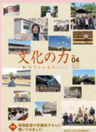
文化の力Vol.4 ~知のフィールドへ~

高知県立大学文化学部は、高知市中心部にあります。大学周辺は文教地区と呼ばれ、高等学校、オーテピア図書館、高知城歴史博物館など、多くの教育施設や公共施設があります。また、永国寺キャンパスから、よさこい祭りの舞台である追手筋や帯屋町も歩いて5分。観光資源にも恵まれた環境で、学生たちは学んでいます。