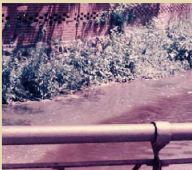
▲江ノ口川と旭川の合流地点。水の色がくっきり違う。

ゼミ生A 私は、その被害を聞く前はある程度自然が壊されても仕方ないんじゃないかと思っていました。なぜかという、国や地方自治体を運営していくためにある程度のお金は必要なので、自然がちょっと壊されてしまっても、雇用が生まれるならばそれでもいいと思っていました。でも、予想以上にひどい公害でした。