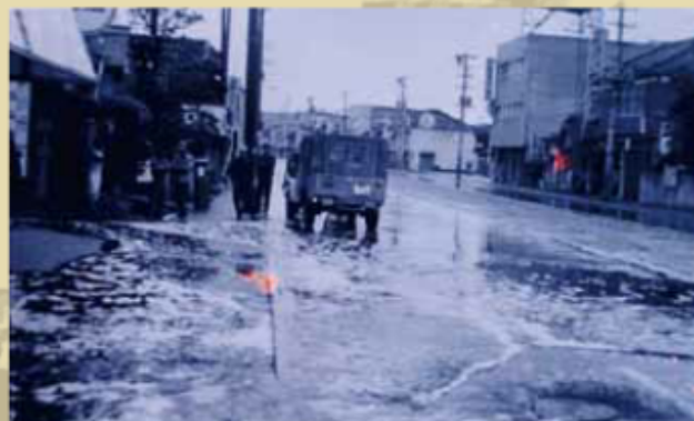
▲1971年6月9日、生コン事件直後の様子 （『よみがえれ!浦戸湾』より）

ゼミ生C ちょっと話は逸れるんですけど、僕信号は絶対守るタチなんです。でも、周りに誰もいなければそんなルール守る必要ないじゃないですか。むしろ、信号を守らない人にいちいち注意するような人って、信号を守る事が正義で、守らない事は悪だと、ある意味思ってると思うんですけど。でも、本当に正しい事ってなんだろう?って思うと、実は信号を守る事はそんなに正義でもない可能性があって。高知パルプ生コン事件はそれをよく教えてくれますよね。法を守ることが別に正義とは限らないと。法を守らない行為が正義として讃えられる事もあるという、凄い例だと思うんですけどね。そういう所が生コン事件の面白い所だなと思います。