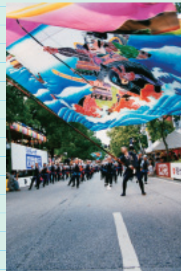
よさこい祭り (高知市) Yosakoi Dance Festival

Often regarded as the last natural and untouched river in Japan. The full length (196 km) runs through 8 cities and towns and then into the Pacific Ocean.