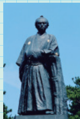
桂浜 (高知市) Katsura Hama

Famous as it appears in the words of a local song. The stage of a famous and tragic love story, which has been handed down from the past.