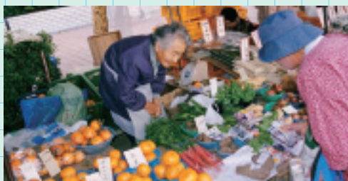
日曜市 (高知市) Sunday Market

Dancers of all ages from all over Japan head to the streets in Kochi City in August. Their energetic dances last until through to the evening.