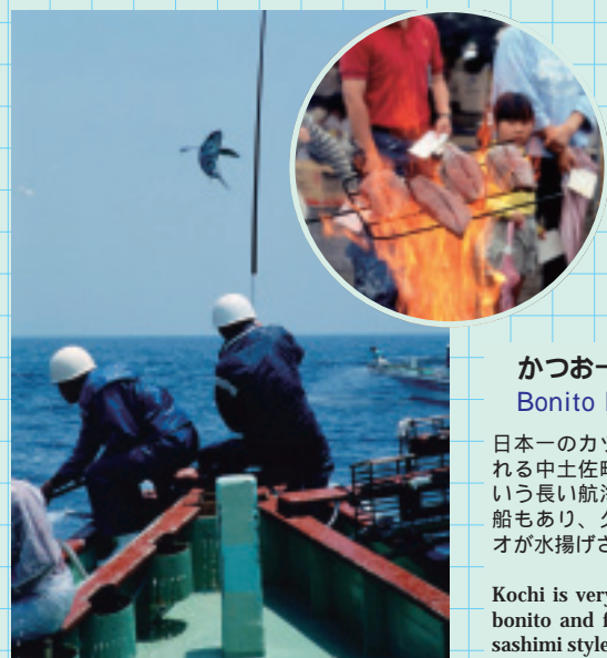
かつお一本釣り (中土佐町) Bonito Fishery

Crossing the center of Kochi City. Several tram types are used, from retro designs to modern European designs. They are loved by many commuters.