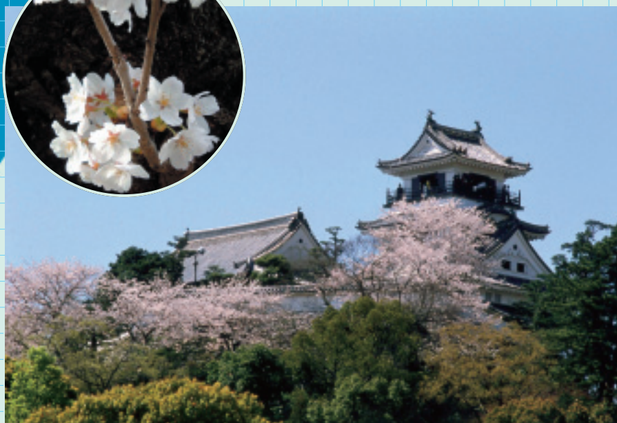
高知城 (高知市) Kochi Castle

慶長8年(1603年)に初代土佐藩主・山内一豊公が築いた南海の名城。平成15年には、築城400年、再建から250年を数えた。「南海道随一の名城」と呼ばれる優美な姿を残しており、国の重要文化財に指定されている。