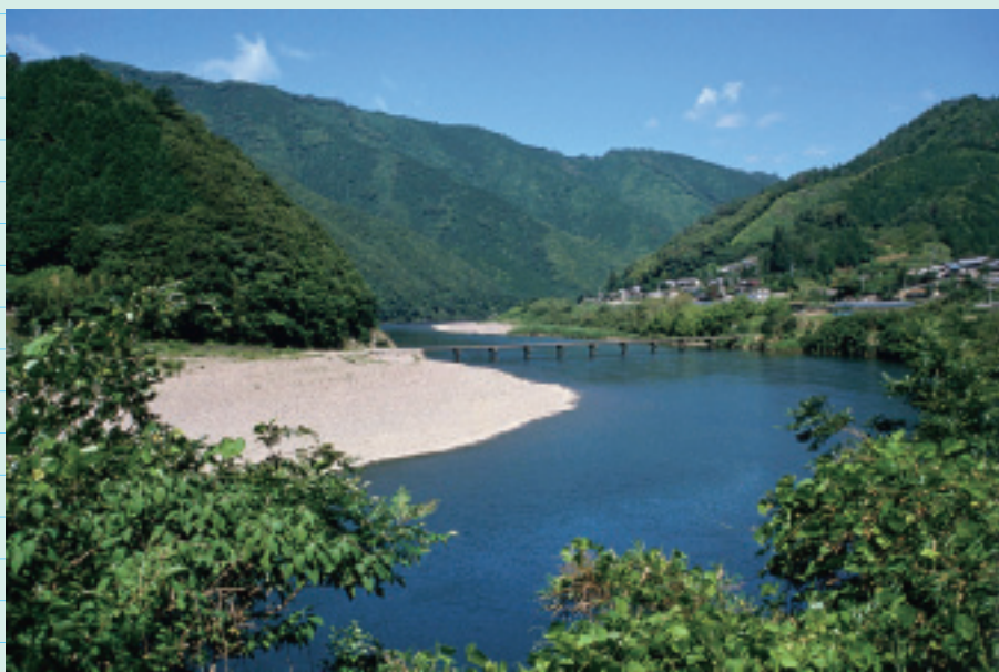
四万十川 (四万十市) Shimanto River

日本最後の清流、全長約 196 km・流域面積 2,270 平方 km。流域 8 市町村の間を繰り返しながら、多くの支流を集めて大河となり、大平洋へと結びついている。高知県で一番長い川。