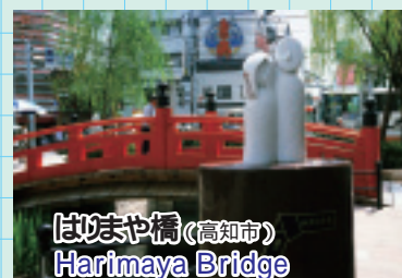
はりまや橋 (高知市) Harimaya Bridge

Built in 1603 by the first feudal lord of the old Kochi area. 250 years have passed since reconstruction. One of the most graceful castles in Japan.