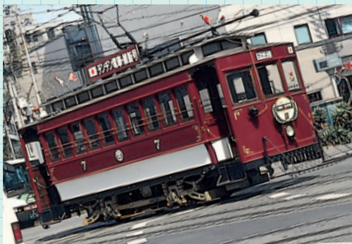
路面電車 (高知市) Tram

The biggest market in Kochi Prefecture with a 300 year history. A variety of agricultural and marine products can be found at hundreds of shops.